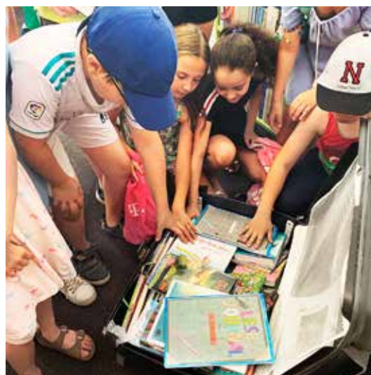
Vollgepackt mit Lesestoff: der Bücherkoffer